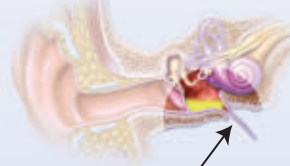
TIKANIK ÖSTAKİ BORUSU